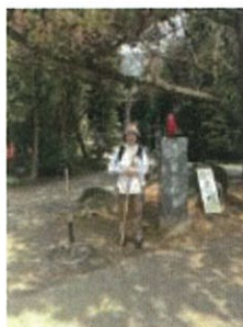
四国 88 か所を歩き遍路で結願しました