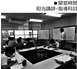
●開室時間 担当講師・指導科目