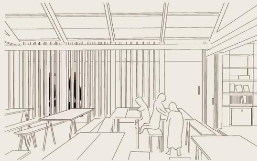
6 スペインから訪れた子供たちが読書室で真言宗の開祖・空海の物語を描いた絵本を読む