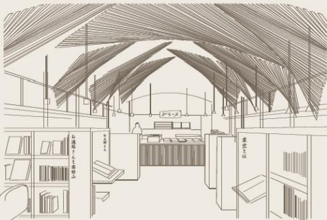
5 書房にてお接待をする高野山内の老舗和菓子屋さん

古くから宗教行事やお祭が行われている「広庭」を歩行者中心の空間へ戻し、参詣者と高野山大学や大師教会を結ぶ書房・接待庵の新設