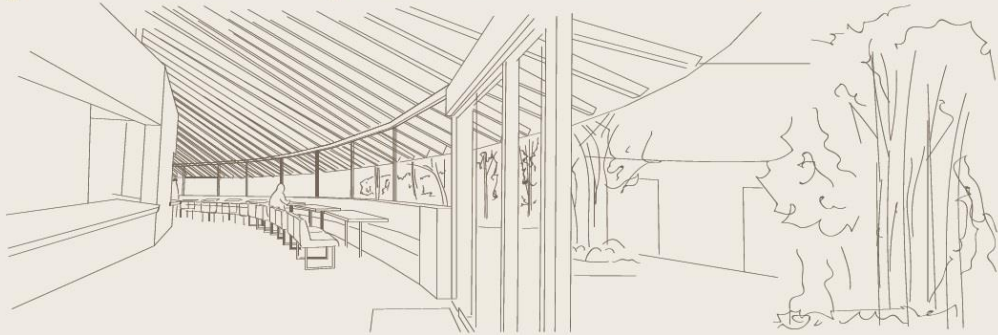
8 奥之院弘法大師御廟へ向かう前に写経をする外国人のおじいさん

既存の案内所を、歩き参詣者のための休憩と奥之院へ参る前に今一度心身を整えるための写経室へ改築