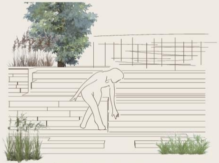
4 手水舎から延長した水の空間でくつろぐ外国人観光客