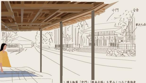
3 壇上伽藍「中門」「根本大塔」を望みくつろぐ参詣者

かつて壇上伽藍の中門前にあった手水舎の再建と町石道（歩道空間）の確保、中門前広場と一服できる東屋の設置