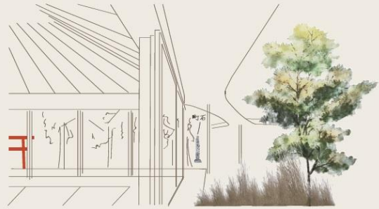
2 子守庵で雨宿りする西院谷地区（大門地区）の子供たち