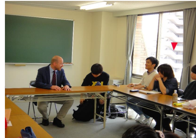
スワイヤー講師 ゼミ風景