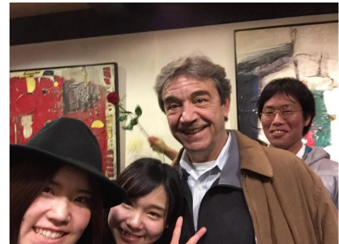
学生に囲まれてご満悦のカネル教授