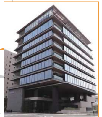
大阪信用金庫 本店

大阪メトロ谷町線「四天王寺前夕陽ヶ丘」駅 北側①出口より東へ徒歩7分 または近鉄「大阪上本町」駅より南へ徒歩12分