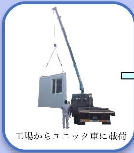
工場からユニット車に載荷