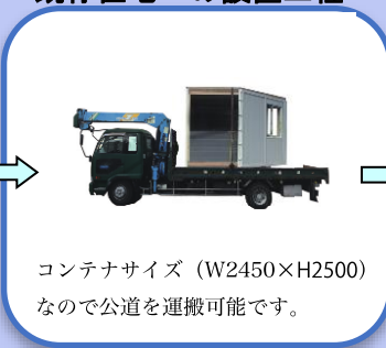
コンテナサイズ (W2450×H2500) なので公道を運搬可能です。