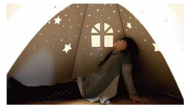
▲トウインクルテント