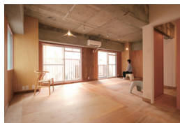
チサンマンション祇園413号 リノベーション

Renovation "Houmukaikan", Japan Society for Graphics Science, Journal of Graphic Science of Japan Vol.50 No.4 pp.11-14