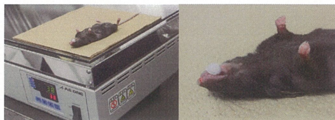
簡便なマウスの唾液採集方法

なお、本研究では、マウスの唾液を採取し、これより IgA の定量を行ったが、これはヒト SARS-CoV-2 感染の場合、サンプル採取は唾液が簡便性と感度において優れていることが示されているためである。ところが、マウスの唾液採取は、実験的に頻用されない手技であり、非侵襲的かつ経時的に採取するのに熟練が要するとされていた。そこで我々は既報の手技を改変し、これまでよりも容易に、かつ比較的多量の唾液をマウスから非侵襲的に採取する方法を確立した(右図)。本研究で我々は、動物モデルを用いて唾液中の IgA のモニタリングをするシステムが確立したが、この方法は、有効な鼻腔 SARS-CoV-2 ワクチンの開発に有用な手段となりうる。