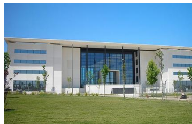
逢甲大学キャンパス

近畿大学学生のための特別プログラムです。中国語(華語)で中国語を学ぶ学習スタイルになります。文化体験授業では水墨画で自分だけの方斗や扇子作りをし、台中市内ツアーでは全台湾初の美術館と図書館が一体化した文化施設・緑美園や国家歌劇院、審計新村を訪問予定です。1日台湾文化ツアーでは、お茶で有名な日月潭を訪問し、自分だけのお茶の葉を作る体験や湖で船に乗り、美しい景色を楽しむことができます。