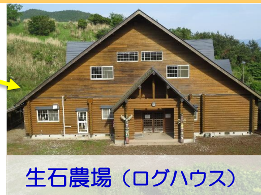
生石農場 (ログハウス)