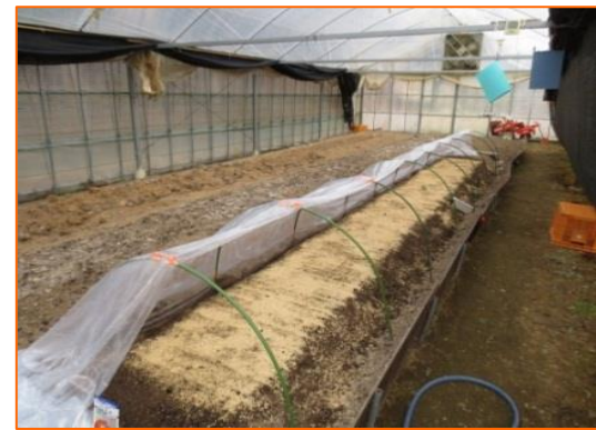
⑤発芽適切温度は 15℃～20℃ で、発芽まで毎朝 1回 の灌水と 1日3回 の温度管理を行っています。