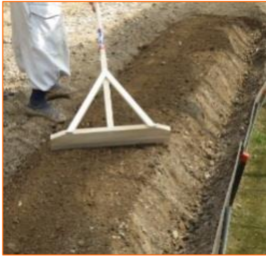
①播種(ハシュ)面の整地

生石農場では、和歌山県産たまねぎが出回らない時期に収穫できる たまねぎ栽培 に挑戦しています。今回は苗床作り・播種作業の様子をご紹介します。