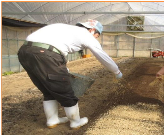
④覆土(フクド) (籾殻で保湿)