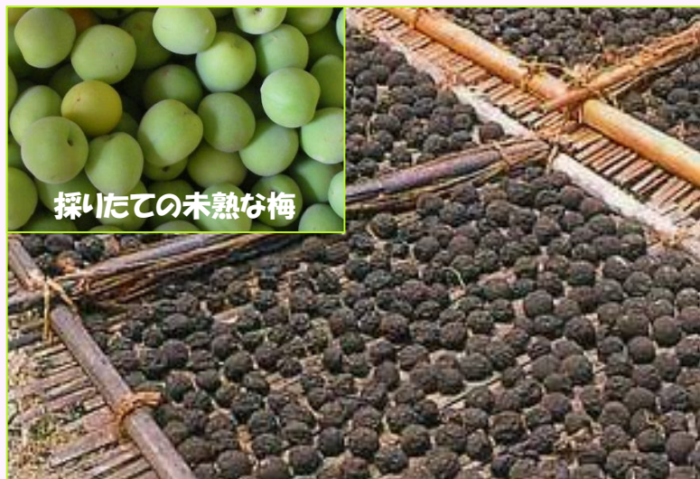
ワラの上で燻した後、天日乾燥されている烏梅