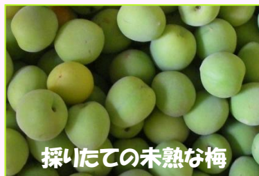
採りたての未熟な梅

鎮痛・解毒作用がある健胃整腸の妙薬として、古くより煎じて風邪薬や胃腸薬として用いてきました。