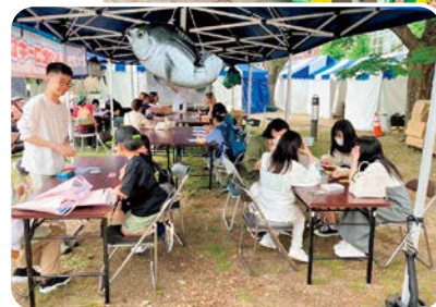
近大ひろば（ブース）