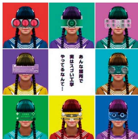
NFT作家カズシフジイ氏が手がけた工学部オープンキャンパスのメインビジュアル

近畿大学工学部（広島県東広島市）は、令和5年（2023年）7月23日(日)、8月5日(土)の2日間、広島キャンパスにおいてオープンキャンパスを開催しました。令和元年度(2019年度)以降、4年ぶりとなる、事前申込不要、人数制限なしの完全対面でのオープンキャンパス開催となりました。当日は、謎解きやお化け屋敷などを活用したイベントプロモーションを企画・プロデュースするクリエイティブカンパニー「マグマワークス」（広島県広島市）をイベント仕掛人に迎え、「謎解き式キャンパス見学」を初開催しました。謎解きのストーリーに関わるメインビジュアルは、広島県出身で世界的に活躍するNFTアーティスト カズシフジイさんとコラボレーション。参加者には、カズシフジイさんのアートによる「オープンキャンパス限定記念コラボグッズ」のプレゼントや、令和5年（2023年）5月から一般利用を開始した新学生食堂「The BASE」にて、ランチメニューを提供する等、イベントは大盛況でした。