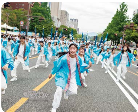
附属東広島高中ダンス部