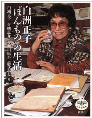
白洲正子 “ほんもの” の生活 白洲正子[ほか]著 / 新潮社刊；2001