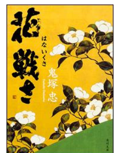
花戦さ / 鬼塚忠著 KADOKAWA, 2016

同じ作者や同じ題材の本を何冊かまとめて読むと、読書の楽しみが増して面白いと思います。