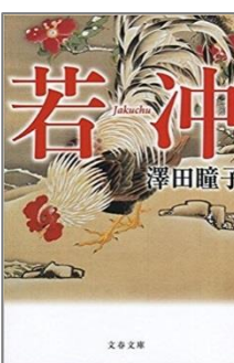
若沖 / 澤田瞳子著 文芸春秋, 2017

色々な趣味の中で、私にとって一番は読書かも知れません。空いた時間を埋める役目はもっぱら読書です。読むのは大抵文庫本です。新作作品は多くは単行本として出版されますが、サイズが大きく持ち運びに不便、それと、値段がお高いので読みたくても我慢をするときが多いです。電子書籍は読むというより見る感覚で、どうも話の世界に入り込めない様な気がして好きになれません。私は、乱読を薦めています、私が読むのはどちらかと言うと歴史や文化に関わる本が多く、目にとまった表題の本を手に取り、適当に半ページほど目を通し、読む気になった本を、大抵何冊か同時に購入します。テレビの対談や新聞のコラムなどで作者の話しに興味をわいたときに、その作者の著作を大人買いしたりもします。昨年、ノーベル賞をもらったカズオイシグロの本も何年か前にまとめて購入しましたが、4冊目ぐらいで挫折しました。不真面目な読み方も時にはします。司馬遼太郎は好きな作家の一人ですが、資料に裏付けされた文章の文中の解説が長くそこを飛ばし読みすることも多いです。