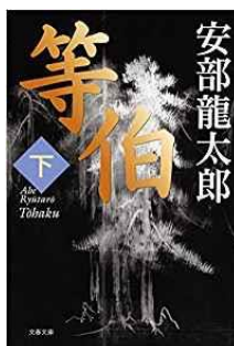
等伯 下 / 安部龍太郎著 文芸春秋, 2015