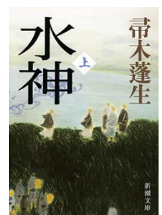
水神 上 / 帯木蓬生著 新潮社, 2012