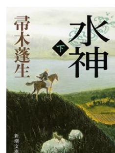
水神 下 / 帯木蓬生著 新潮社, 2012