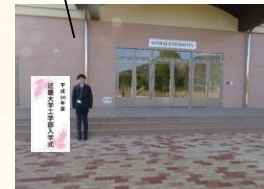
◆入学式会場前◆ 華やかな看板のフオトスポットです。