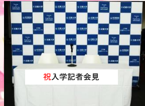
◆メディアセンター内◆ 記者会見風のフオトスポットです。

新入生の皆様、ご入学おめでとうございます。保護者の皆様にも、心よりお祝いを申し上げます。近畿大学工学部では皆さんの入学を記念して入学記念フオトスポットをご用意しております。友人やご家族との記念撮影にぜひご利用ください。