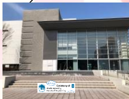
◆メディアセンター前◆ 英語の看板のフオトスポットです。