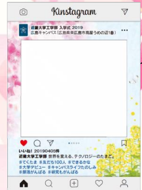
◆メディアセンター内◆ インスタ風パネルです。自由に移動できます。