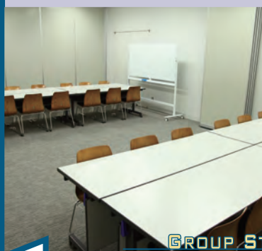
GROUP STUDY ROOM

2～12人で利用できるグループ研究室です。サービスカウンターで申し込みをして利用してください。利用可能時間は約3時間です。