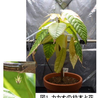
図1. カカオの幼木と花