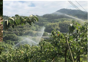
図3. 中山間地でも通信可能なネットワーク機器の開発と機器を使用した遠隔灌水