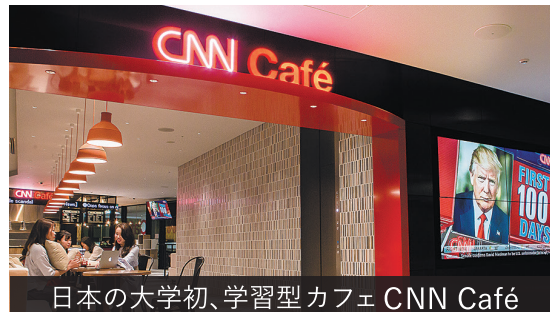
日本の大学初、学習型カフェ CNN Café