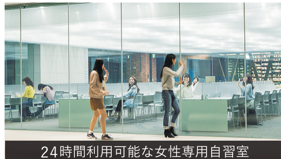
24時間利用可能な女性専用自習室