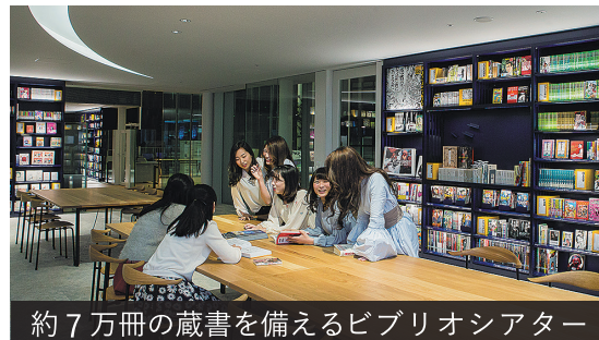
約7万冊の蔵書を備えるビブリオシアター