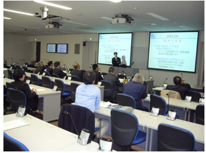
セカンドメジャー制度の取組について説明される古南准教授（左）と中野教授（右）