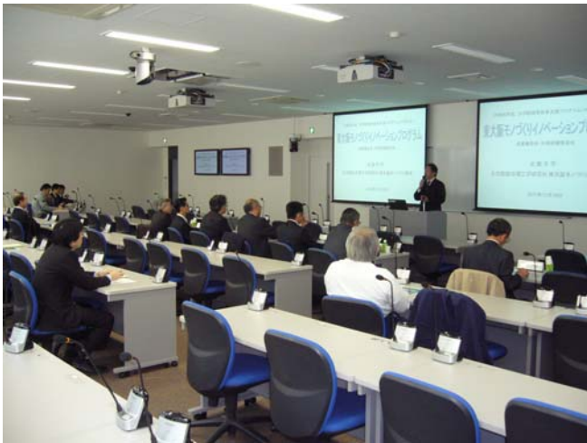
沖取組代表からの概要説明