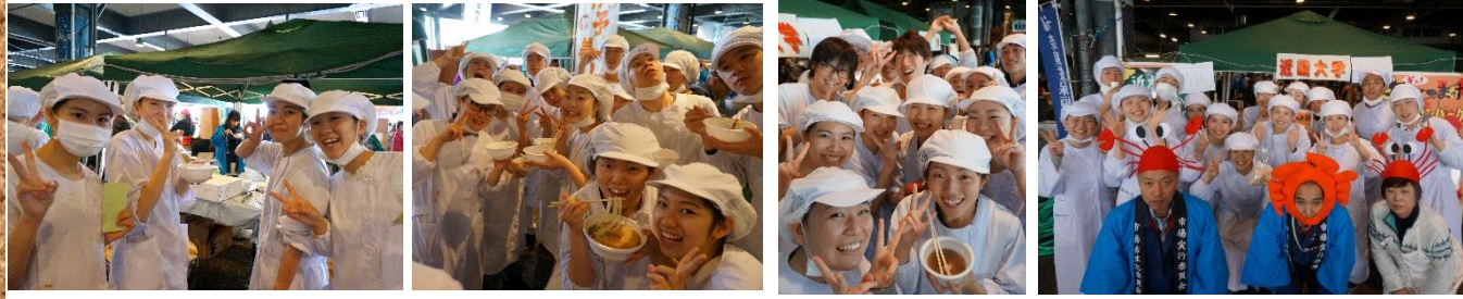
市場のブースを巡り、様々な料理を楽しく食べている様子!

多めに作っていたデミグラスソースが少し余っていたので、ハヤシライスとして100円で販売するも数分で完売! お客様からは「すごく美味しかった!」、「来年も楽しみにしているよ」、「近大はいつも並んでいるね」など嬉しいお声をかけていただき、学生たちは大喜びの一日でした! その後、滅多に体験できない卸売市場を満喫。沢山のブースのお食事を頂き、満面の笑顔! 楽しい機会を与えて下さいました奈良県中央卸売市場の皆様、本当に有難うございました!