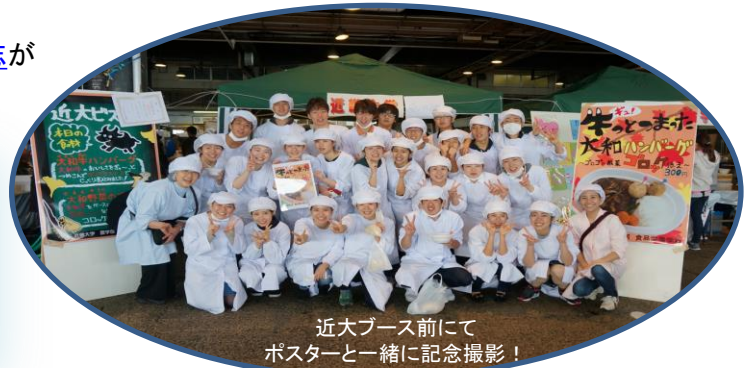
近大ブース前にて ポスターと一緒に記念撮影！

受賞メニューは2ヶ月前の9月から打ち合わせと試作を繰り返し、「 ギョ! 牛つつまった大和ハンバーグ ゴロゴロ根菜ゴロッケ添え」に決定。前日から仕込みをし、当日は朝7時40分に集合。息つく暇も無く、すぐに販売準備を開始。