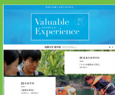
サイトトップ画面(2018年6月12日現在)

農業生産科学科 / 水産学科 / 応用生命化学科 / 食品栄養学科 / 管理栄養士養成課程 / 環境管理学科 / 生物機能科学科